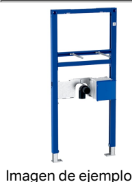
Imagen de ejemplo